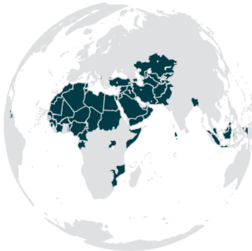
Les états-membres de la BisD en 2019